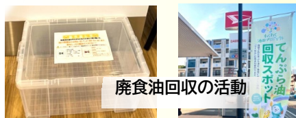
廃食油回収の活動