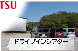
ドライブインシアター