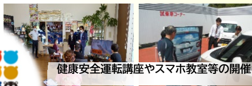
健康安全運転講座やスマホ教室等の開催