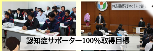
認知症サポーター100%取得目標