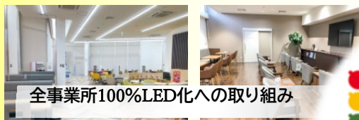
全事業所100%LED化への取り組み